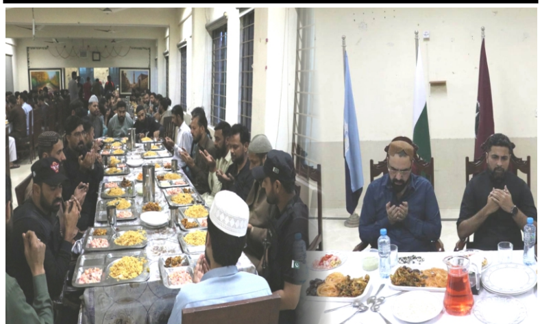
SSP CTD arranges "iftar dinner" with police officials