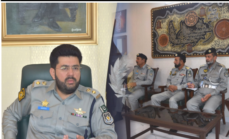
CTO orders officials to maintain smooth flow of traffic on roads