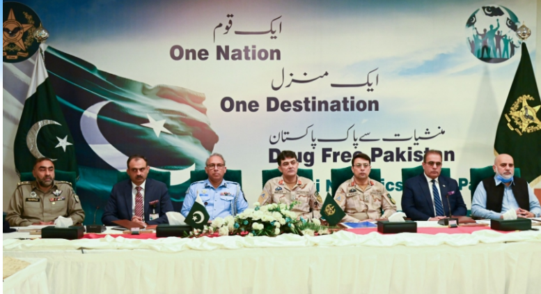
The Anti-Narcotics Force (ANF) holds an Inter-Agency Task Force (IATF) meeting to discuss efforts in combating drug trafficking across Pakistan, engaging all law enforcement agencies and relevant departments. Islamabad Capital City Police Officer (ICCP) Dr. Akbar Nasir Khan participated in the meeting representing the Islamabad Capital Police. The meeting deliberated on sustaining robust crackdowns against drug trafficking and dealers.