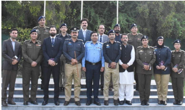
Delegation of Mid Career Management Course visits Safe City Islamabad