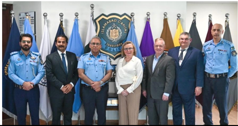
اسٹی نارکوٹکس فورس نے انسداد منشیات کی کوششوں میں مصروف پاکستان کے تمام قانون نافذ کرنے والے اداروں اور دیگر گھنٹوں کی انٹرا ایجنسی ٹاسک فورس (IATF) اجلاس کا اہتمام کیا، آئی سی پی او ڈاکٹر اکبر ناصر خاں نے اسلام آباد کیمپینل پولیس کی نمائندگی کرتے ہوئے اس اجلاس میں شرکت کی، اجلاس میں منشیات کے تدارک اور منشیات فروشوں کیخلاف بھرپور کریک ڈاؤن کو جاری رکھنے پر تبادلہ خیال کیا گیا