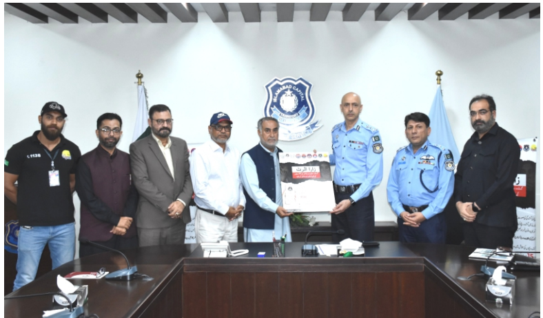
Islamabad Police will collaborate with ZARRA alert for recovery of missing children